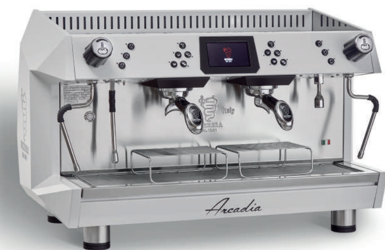
ARCADIA BREWING PROFILE TOTAL WHITE