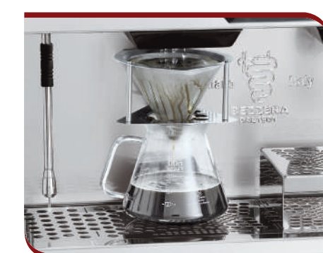
Drip coffee brewing