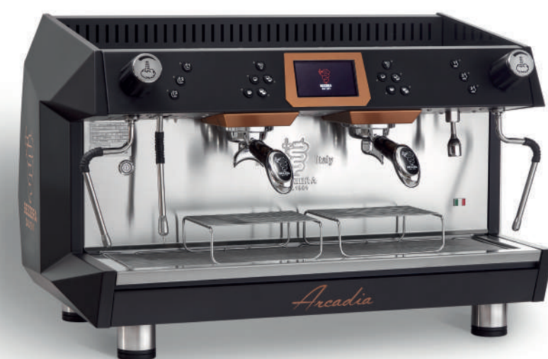
ARCADIA BREWING PROFILE TOTAL BLACK