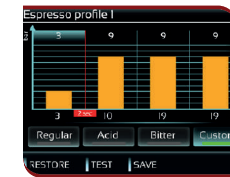
Brewing pressure profile system